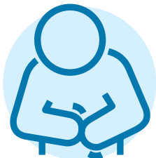
ਦਿਲ ਕੱਚਾ ਹੋਣਾ, ਦਸਤ ਅਤੇ ਕਬਜ਼