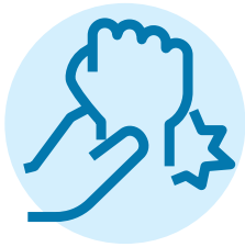
ਮੋਚਾਂ ਅਤੇ ਜਿਸਮਾਨੀ ਤਣਾਅ

ਤੁਹਾਡੇ ਫੈਮਿਲੀ ਡਾਕਟਰ ਜਾਂ ਨਰਸ ਪ੍ਰੈਕਟੀਸ਼ਨਰ ਤੁਹਾਡੀਆਂ ਸਿਹਤ-ਸੰਭਾਲ ਦੀਆਂ ਲੋੜਾਂ ਨੂੰ ਸਭ ਤੋਂ ਬਿਹਤਰ ਸਮਝਦੇ ਹਨ, ਪਰ ਜੇਕਰ ਤੁਸੀਂ ਉਨ੍ਹਾਂ ਨੂੰ ਨਹੀਂ ਮਿਲ ਸਕਦੇ, ਤਾਂ ਉਨ੍ਹਾਂ ਸਿਹਤ ਚਿੰਤਾਵਾਂ ਲਈ ਜਿਨ੍ਹਾਂ ਨਾਲ ਜਾਨ ਨੂੰ ਖਤਰਾ ਨਹੀਂ ਹੈ, ਉਸੇ ਦਿਨ ਮਿਲਣ ਵਾਲੀ, ਤੁਰੰਤ ਦੱਖਭਾਲ ਵਾਸਤੇ ਅਰਜੈਂਟ ਅਤੇ ਪ੍ਰਾਇਮਰੀ ਕੇਅਰ ਸੈਂਟਰ (Urgent and Primary Care Centre, UPCC) ਜਾਓ।