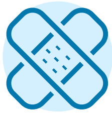
ਕੱਟ, ਜ਼ਖਮ ਜਾਂ ਚਮੜੀ ਦੀਆਂ ਅਵਸਥਾਵਾਂ