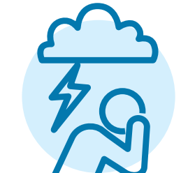
ਮਾਨਸਿਕ ਸਿਹਤ ਸੰਬੰਧੀ ਚਿੰਤਾਵਾਂ ਜਿਵੇਂ ਕਿ ਮੁੜ ਖਰਾਬ ਹੋਣਾ, ਐਂਗਜ਼ਾਇਅਟੀ (ਬੇਚੈਨੀ ਜਾਂ ਚਿੰਤਾ) ਜਾਂ ਡਿਪਰੈਸ਼ਨ (ਉਦਾਸੀ)