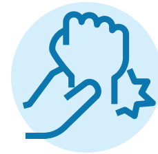
بیخ‌خوردگی و کشیدگی