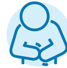
حالت تهوع، اسهال و یبوست