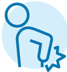
درد جدید یا بدترشده