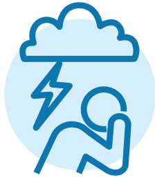
مشکلات سلامت روان مانند تنگ خلقی، اضطراب یا افسردگی