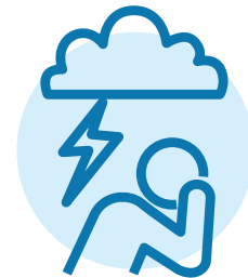
心理健康问题，例如情绪低落、焦虑或抑郁