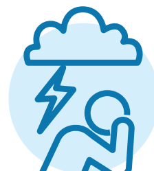
與情緒有關的問題，例如情緒低落、焦慮或抑鬱