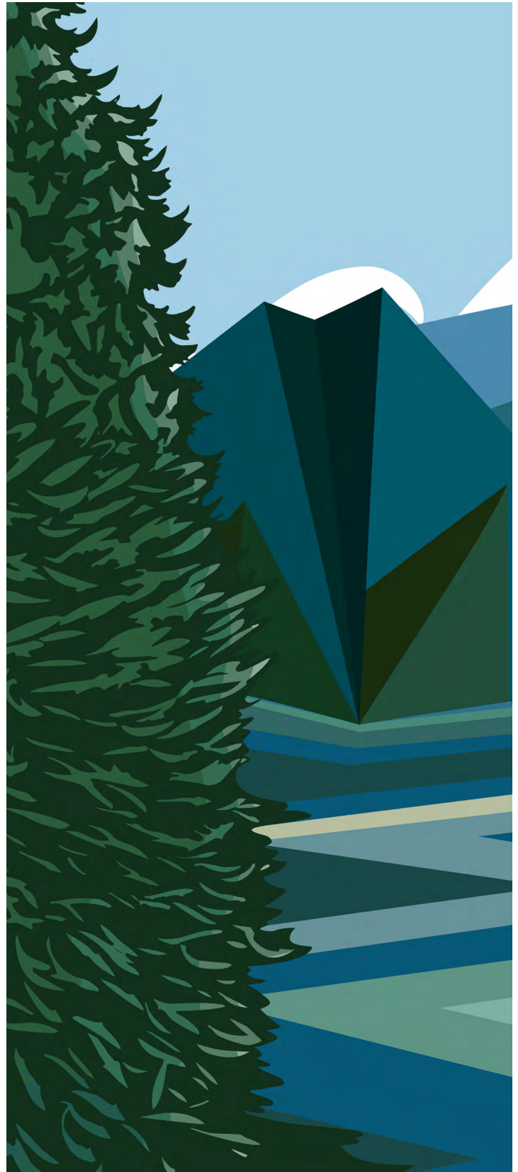
아티스트: Carrielynn Victor